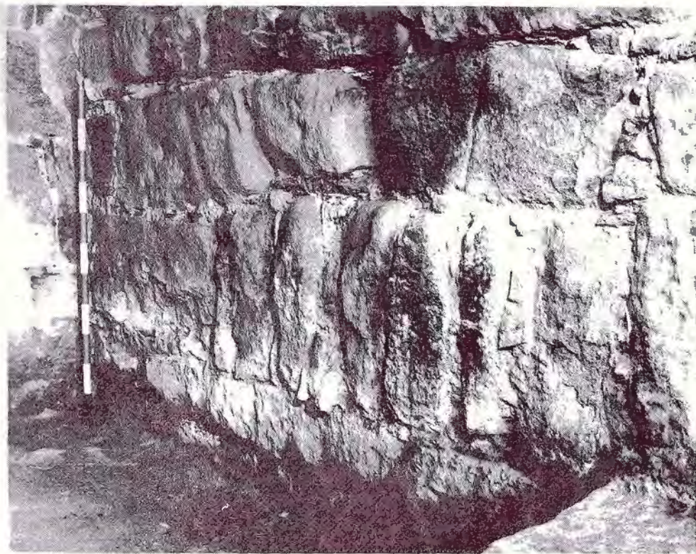
Sorba. Parament en vertical de la nau visigòtica, s. VII.

Nau de 3,06 m. de llargada per 3,86 m. d'amplada. Poc n'ha quedat, però es suficient per a demostrar-ne l'antiguitat. El parament és gros i les pedres molt gastades, com si haguessin estat llarg temps a la intempèrie. Unides amb argamassa forta de calç, corresponen a una construcció que es recolza en part en el basament del que devia ser, al seu principi, arc frontal de l'atri, i amb el temps basament de l'arc triomfal de l'època romànica; a continuació s'estén un pany de paret de 3,06 m. de llargada, del qual es conserven tres filades visibles; en la filada del mig, feta amb grans pedres verticals, figura un maó romà gros, sencer, reaprofitat. Un empedrat longitudinal i un banc de pedra i argamassa ran dels murs laterals, emmarcava un paviment d'argila piconada, sense gaire calç, construït a uns 10 cms. per sota el paviment d'opus signinum