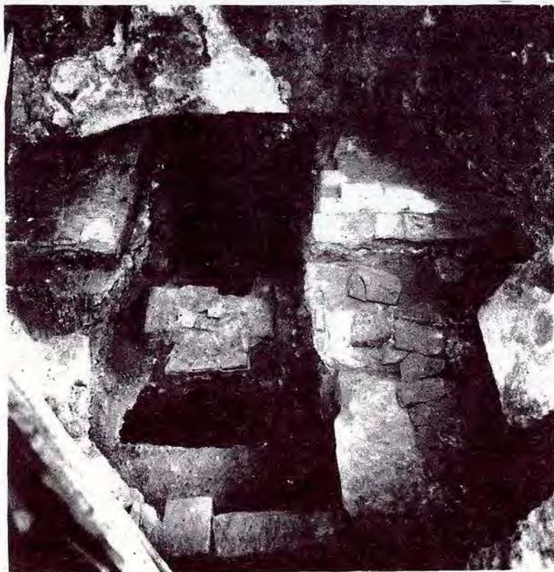
Interior de la Rotonda del s. VI, al centre l'edicle, al seu davant el sepulcre.

ser també en tenia al tercer costat però, adossat a l'església moderna, no es veu—. Finestres actualment aparedades, d'arc de mig punt monolític i d'un metre d'altura per fora, per dins formades per dovelles petites, i la porta al S.O., aparedada en construir-se l'escala a la sagristia actual. Les excavacions han demostrat, també, que els fonaments exteriors són de planta quadrada.